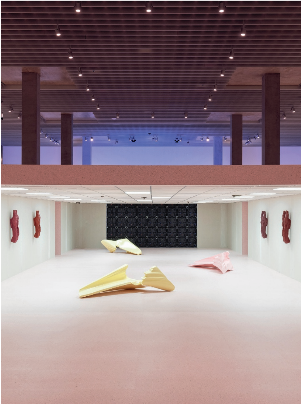
«Shahryar Nashat – Streams of Spleen», Ausstellungsansicht MASI, Lugano.