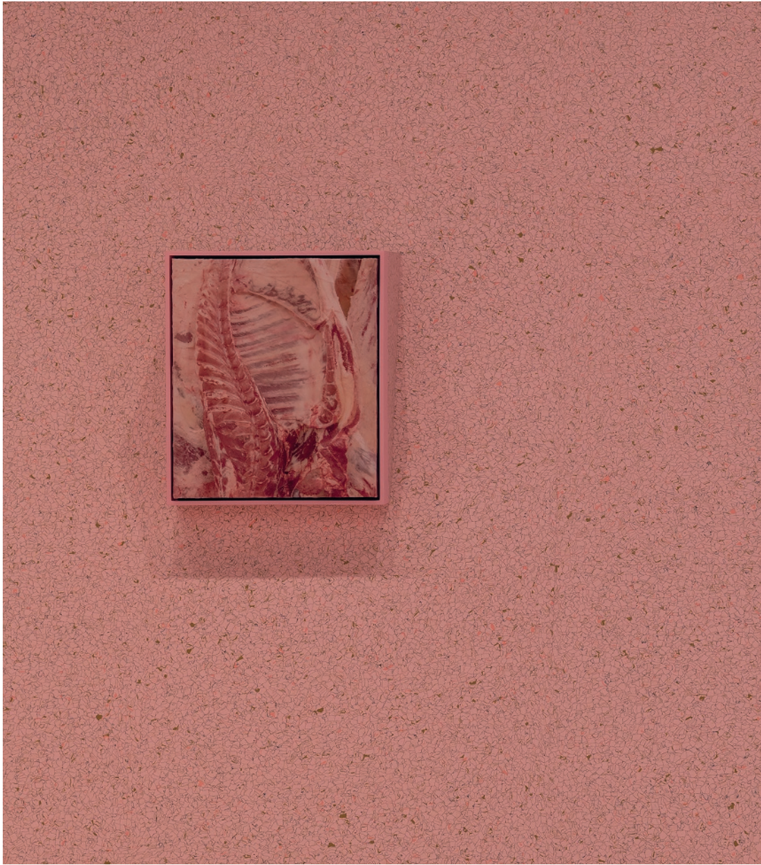
Shahryar Nashat, «Brother_03.JPEG», 2023 (links), Acrylgel, Tinte auf Papier, Sperrholz, 38 x 32,5 x 4,3 cm; «Boyfriend_15.JPG», 2022 (rechts), Polyesterharz, Fiberglas, 57 x 190 x 123 cm, Courtesy Gladstone Gallery, New York, Ausstellungsansicht MASI, Lugano. Foto: Luca Meneghel