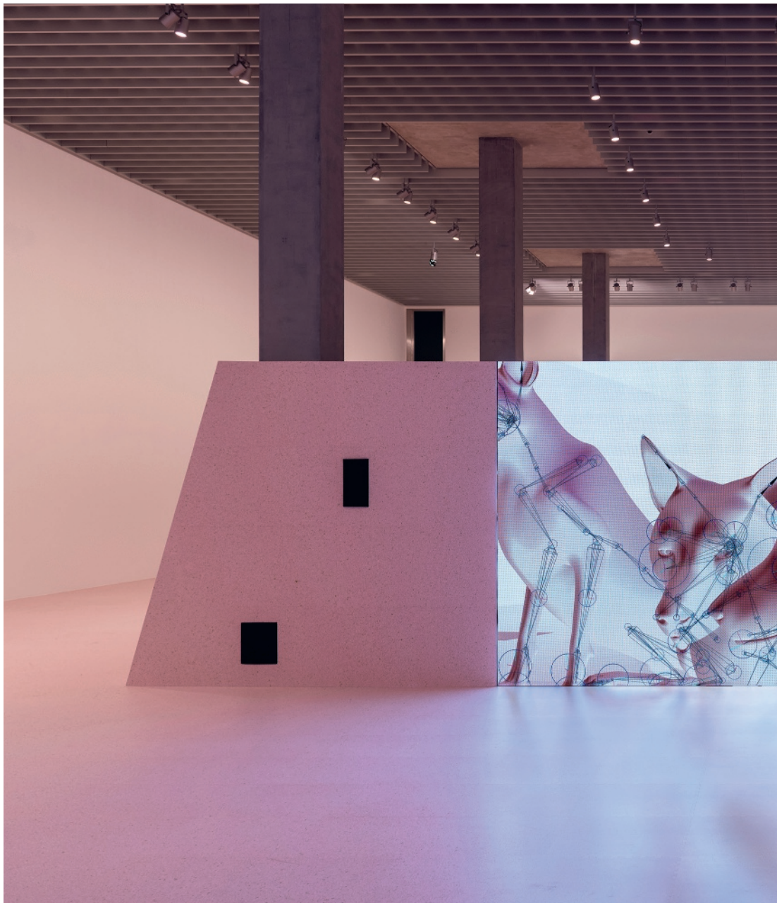
Shahryar Nashat, «Warnings», 2024, HD-Video, Loop auf LED-Wand, 9'59", Ausstellungsansicht MASI, Lugano.